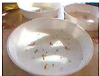
お皿に水を入れて濁しています