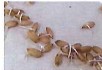
ニョキニョキと 芽が出てきました!