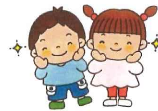
ほほえみ輝くやさしい子