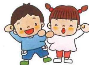
やる気いっぱい元気な子