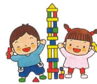
力を合わせて頑張る子