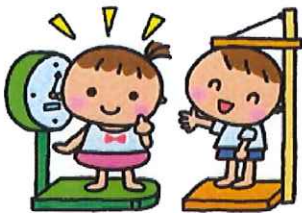
右記の表は1年間の身長・体重報告です