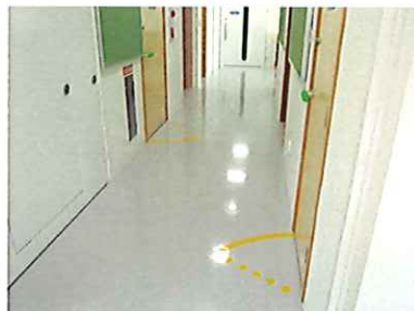
◎0・1クラスは床暖房