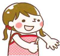
脇の下の中央部分に体温計の先を当てる。