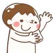
脇の下の汗を拭く。

体温は、動いた後や食事の後、また気温によって一日の中で変動します。測定は脇の下や耳で測定するのが一般的で、正確に測定するには、運動後や食後を避け、測定中は体温計の位置を変えないようにしましょう。お子さまの平熱を知っておくのも大切です。