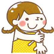
体温計を下から45度の角度になるように挟み、脇をきちんと閉じて数分待つ。